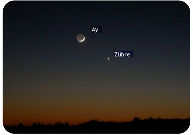
Ay ve Zühre'nin gökyüzünde birbirine yakın konumdayken Güneş battıktan bir süre sonra çekilmiş fotoğrafı

Zühre'nin geceleri gökyüzünde Ay'dan sonra en parlak gök cismi olarak gözüktüğünü yazının başında belirtmiştik. Boyut olarak hemen hemen Dünya'mız kadar büyük ve bize en yakın gezegen olması nedeniyle bazı zamanlarda akşam Güneş battıktan sonra hava kararmaya başladığında, diğer yıldız ve gezegenlerden önce göze ilk çarpan gök cismi Zühre olur. 31 Güzel parlıtısından dolayı geçmişte yaşamış pek çok putperest müşrik toplumda farklı isimler altında güzellik tanrıçası olarak tapınılmış ve mitolojilerinde önemli bir yer verilerek adına tapınaklar bile yapılmıştır.