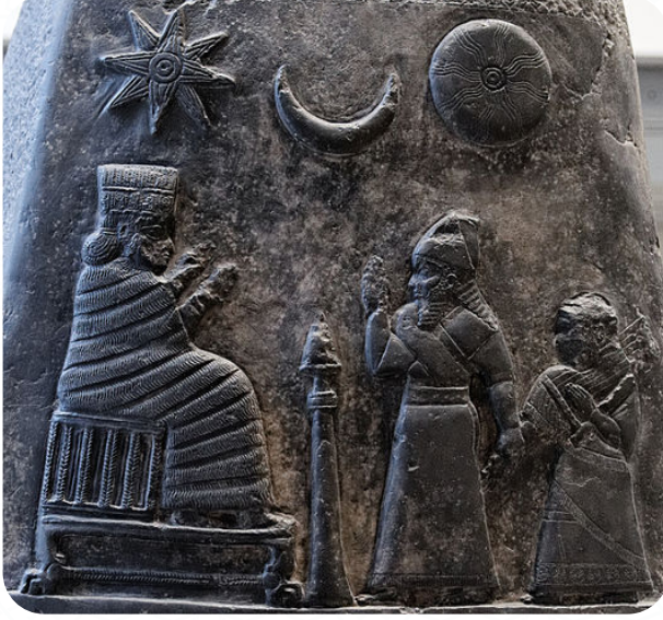
Babil Kralı 2. Meli-Shipak'ın Kuddurusu (Taş Belgesi) üzerinde Zühre (o dönemki ismiyle İştâr) Gezegeni, Hilal ve Güneş – Louvre Müzesi

lenmiş ve böylece hem doğuştan gelen haklara hem de onun olağanüstü yeteneklerine sahip olmuştur. 29 Tıpkı Marduk gibi çeşitli tanrıların özelliklerini kendisinde toplayan bir diğer tanrı da Tanrıça İştâr'dır. Sümer ve Sami kavimlerinin bir karışımı olarak Babil toplumunda ortaya çıkan İştâr, hem erkek hem de dişi özellikleri taşımıştır. 30