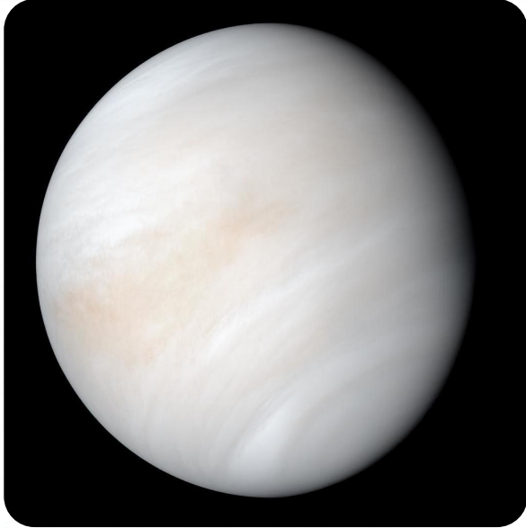
Mariner 10 uzay aracı tarafından Zühre gezegeninin 1974 yılında çekilmiş fotoğrafı

Gökleri, yeri ve bunların arasındakileri yoktan var eden, çok güçlü ve her şeyi bilen Allah'a hamd, bizlere Allah'ın ayetlerini okuyan, bizleri arındıran, bizlere Kitab'ı ve hikmeti öğreten Peygamberimize salât ve selam olsun. Yüce Rab-bimizin sonsuz ilim ve kudretiyle yarattığı gökyüzü süsleri olan gezegenleri yakından tanımaya devam ediyoruz. Önceki sayılarımızda Güneş'e en yakın gezegen olan Utarid'i (Merkür) inceledikten sonra sıradaki konuğumuz, Güneş'e olan uzaklığına göre ikinci sırada bulunan ve Dünyamıza en yakın gezegen olan Zühre (Venüs) olacak, inşallah.